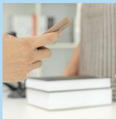
専用発券機で発券